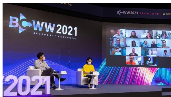
BCWW国際フォーマットピッチングの様子

シンガポールでオンライン開催されたContent Asia AwardsのBest Asian Original Game Showにおいてもノミネートされるなど、日本版を元に各国版のリメイク制作権を販売する「フォーマット番販」としての評価が高まっております。